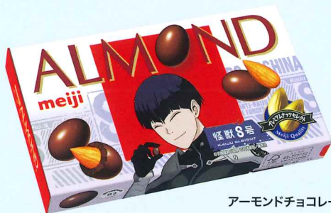
アーモンドチョコレート怪獣8号