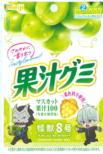
果汁グミマスカット怪獣8号