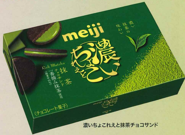
濃いちょこれえと抹茶チョコサンド