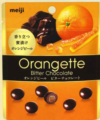
オランジェットパウチ