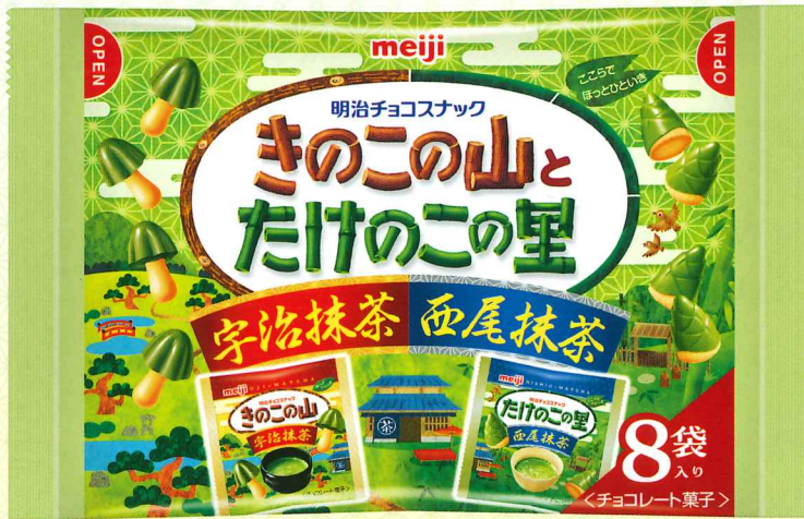
きのこたけのこ抹茶袋