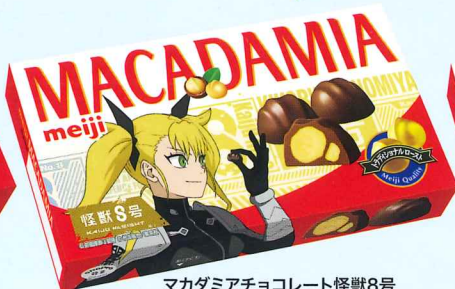
マカダミアチョコレート怪獣8号