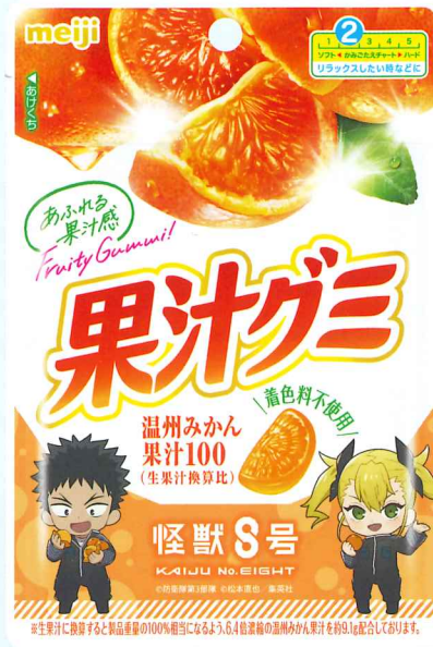
果汁グミ温州みかん怪獣8号