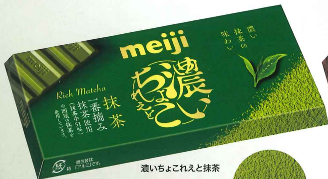
濃いちょこれえと抹茶