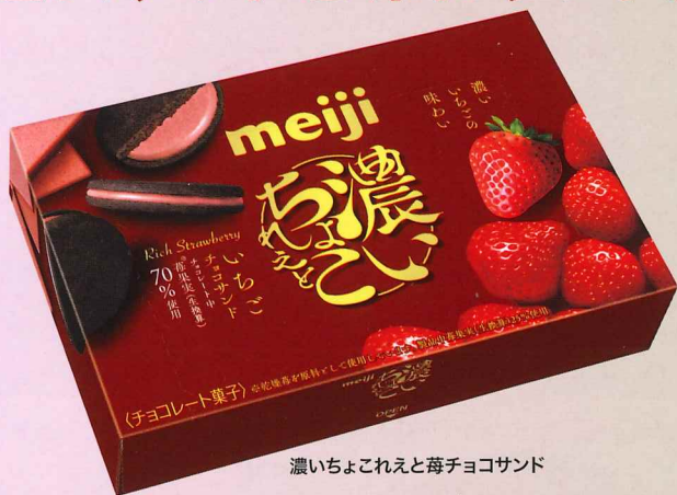
濃いちょこれえと苺チョコサンド