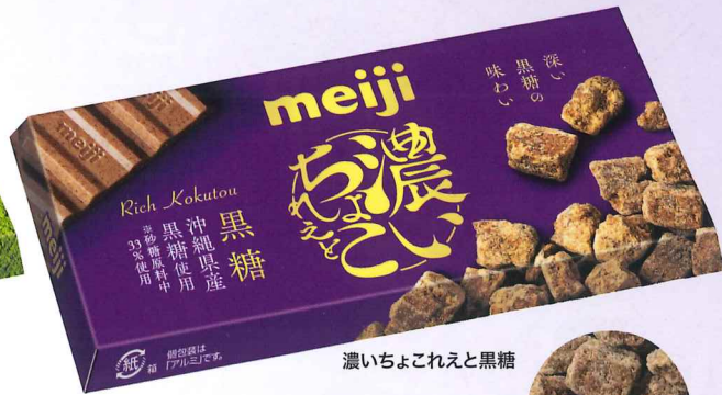
濃いちょこれえと黒糖