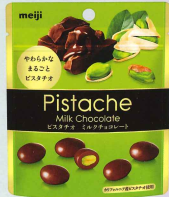
ピスターシュパウチ