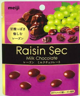
レザンセックパウチ