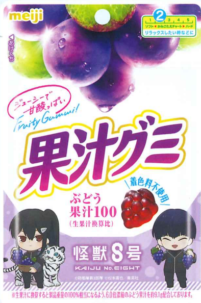
果汁グミぶどう怪獣8号